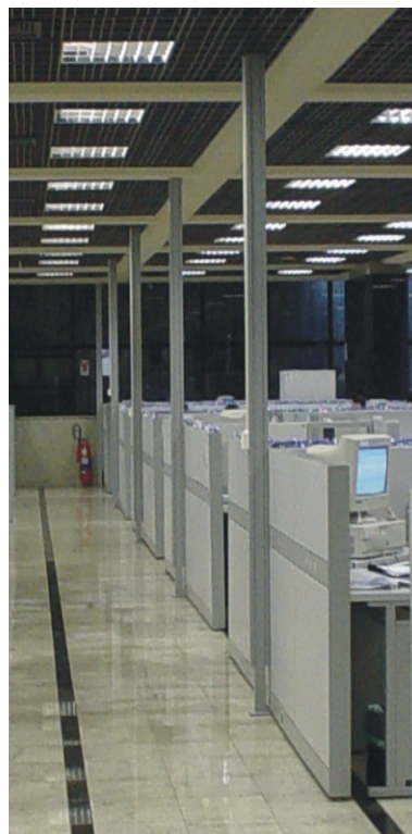
Exemplo de ambiente com a aplicação de Colunas Standard