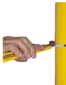
Tipo do Removedor Standard (1) Slim(2) DT 90090 DT 90095

Removedor de Tampas para duto Slim e sua utilização.