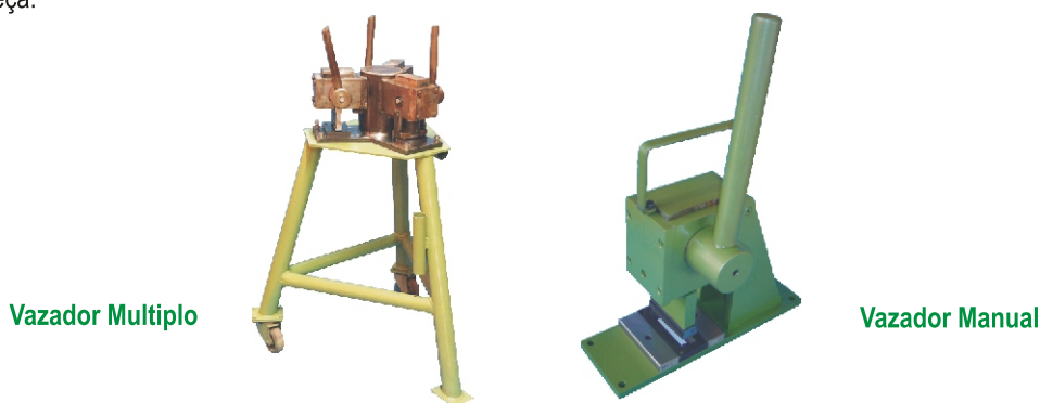
Tipo do Vazador Múltiplo Manual DT 90040 DT 90080

Ferramentas utilizadas para facilitar a confecção de furos em dutos durante a execução dos serviços na obra. Possuem dois modelos. Embalagem com 1 peça.