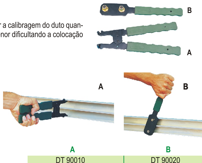
A B DT 90010 DT 90020

Ferramentas utilizadas para auxiliar a calibragem do duto quando a abertura do mesmo estiver menor dificultando a colocação das tampas.