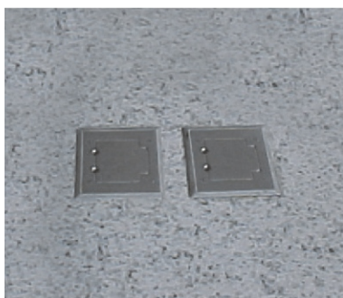
Detalhe de Caixa de Piso Simples em piso de granito.