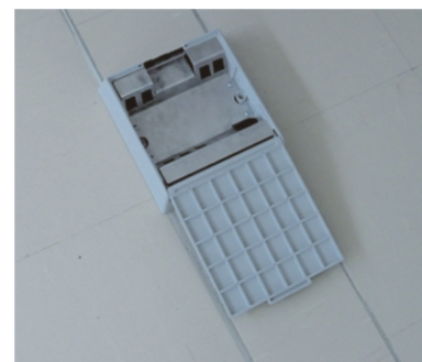
Detalhe da caixa de sobrepor em duto canal.