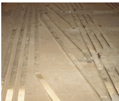
Detalhe do lançamento de dutos Standard para aplicação de Caixa de Piso Simples.