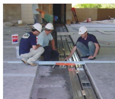
Detalhe do lançamento de duto canal. Uso de caixa de equipamento de sobrepor utilizando duto canal.