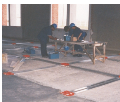
Detalhe do lançamento de dutos Standard para aplicação de Caixa de Piso Simples.