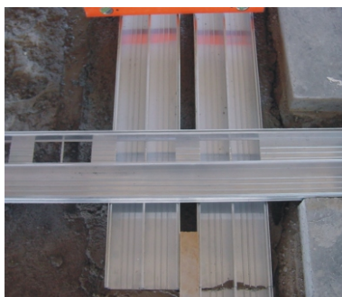
Detalhe do cruzamento dos dutos canal.