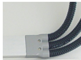
Exemplo de Adaptador aplicado em Duto Standard.