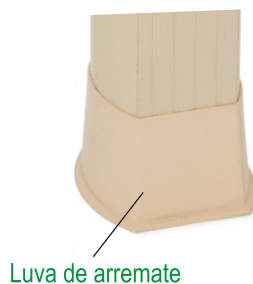
Luva de arremate