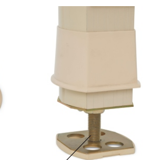
Parafuso inferior de 0,20 cm