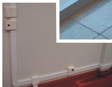
Porta Equipamento Plus