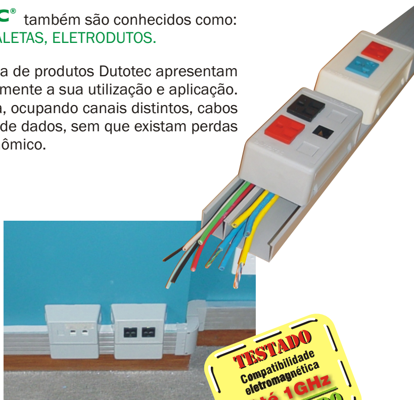
Porta Equipamento PLUS

Utiliza os laboratórios da Cientec - Fundação de Ciência e Tecnologia para elaboração de testes e emissão de laudos técnicos dos produtos.