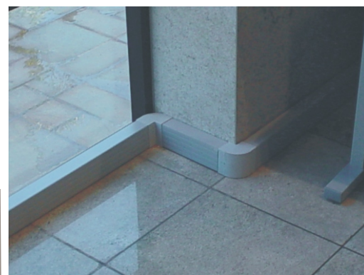
Aplicação de Duto Standard em área nobre

O alumínio natural apresenta uma baixíssima taxa de oxidação o que lhe confere a classificação de Resistente a corrosão para ambientes normais . O alumínio apresenta excelente estabilidade dimensional, estrutural e excelente resistência física.