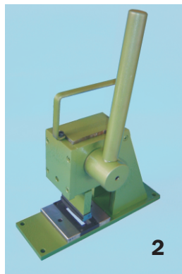
Vazador Manual DT 90080

2 - Vazador manual: Herramienta utilizada para hacer agujeros en ductos en la obra.