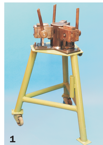
Vazador Múltiple DT 90040

2 - Vazador manual: Herramienta utilizada para hacer agujeros en ductos en la obra.